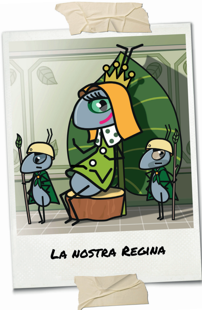
LA NOSTRA REGINA

Bisbigliò sottovoce - Sua Maestà ha da poco terminato la